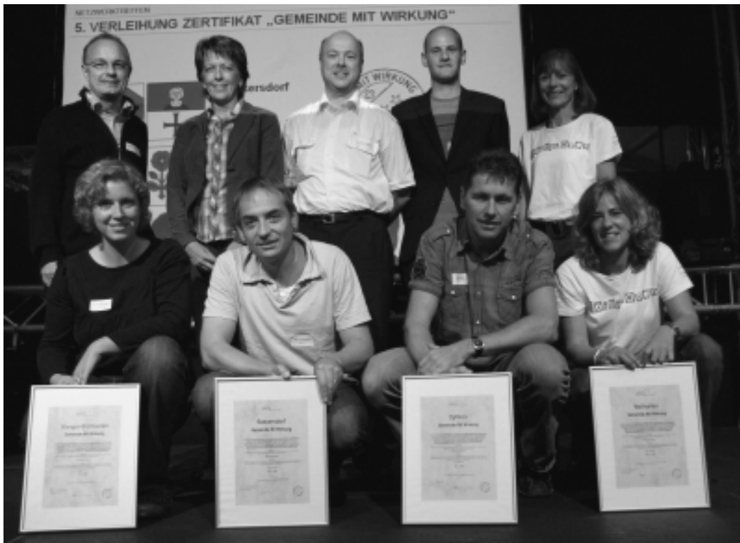
Verleihung des Zertifikats an Bassersdorf, Opfikon, Wallisellen und Wangen-Brüttisellen.

Jugend Mit Wirkung wird unterstützt von: